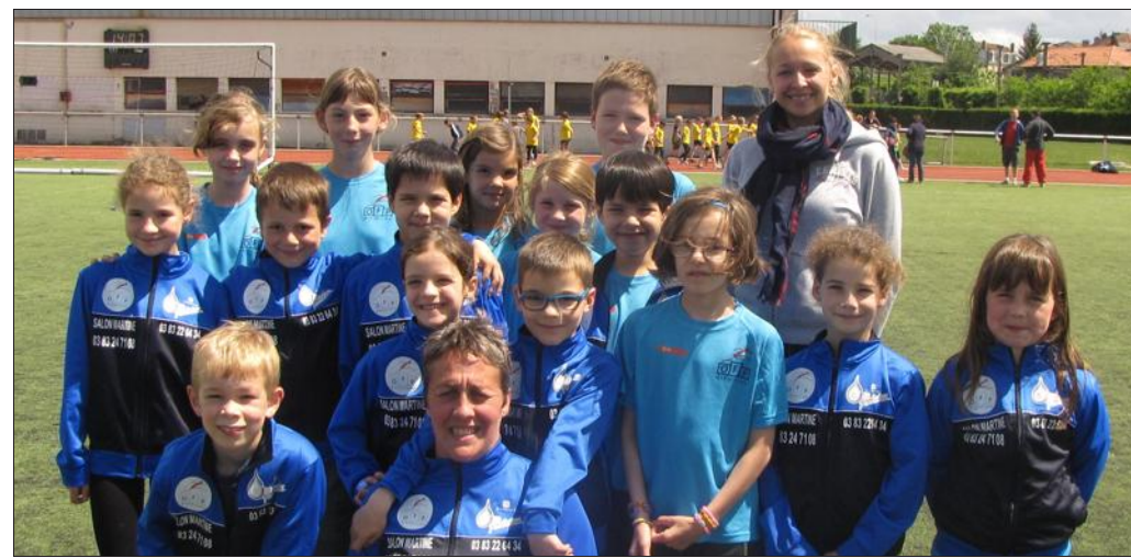
■ Les jeunes de la section ont allié efforts et ténacité.

Le Kid's Athletic est une animation mise en place par la Fédération française d'Athlétisme pour éviter que les plus jeunes ne se spécialisent trop vite et puissent « jouer » à l'athlétisme plutôt que de faire de la compétition dès le plus jeune âge. C'est à l'athlétisme ce que la Baby Gym est à la gymnastique artistique.