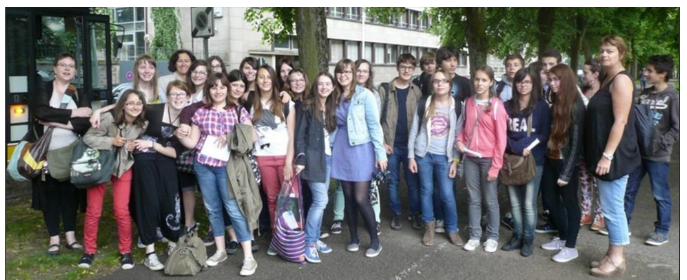
■ Une journée faite de belles rencontres