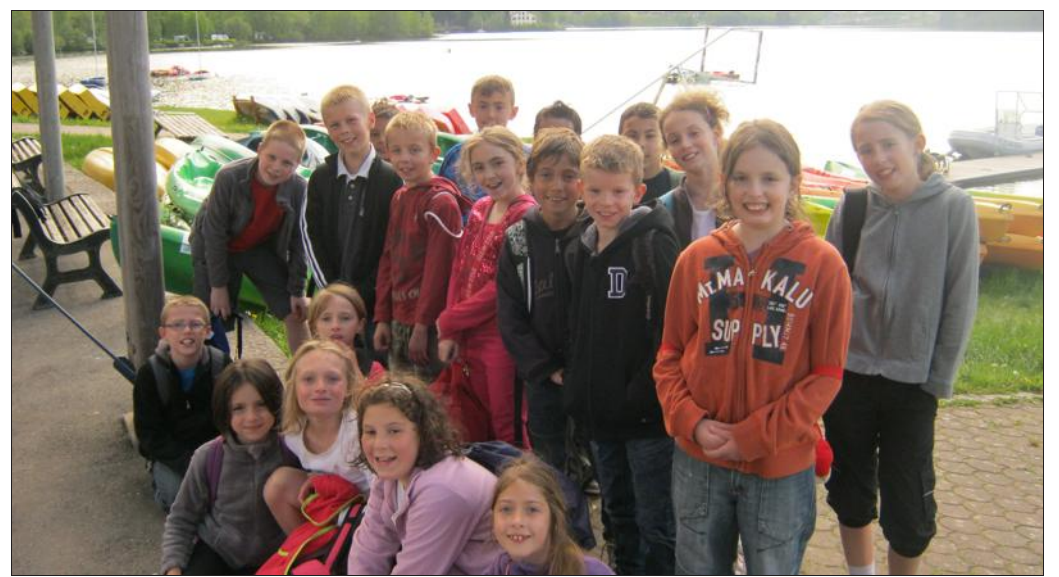
■ Une séance de canoë fort plaisante pour les élèves

Après s'être confortablement installés dans leur quartier au centre Clair-Sapin à Arrentes de Corcieux dans les Vosges,