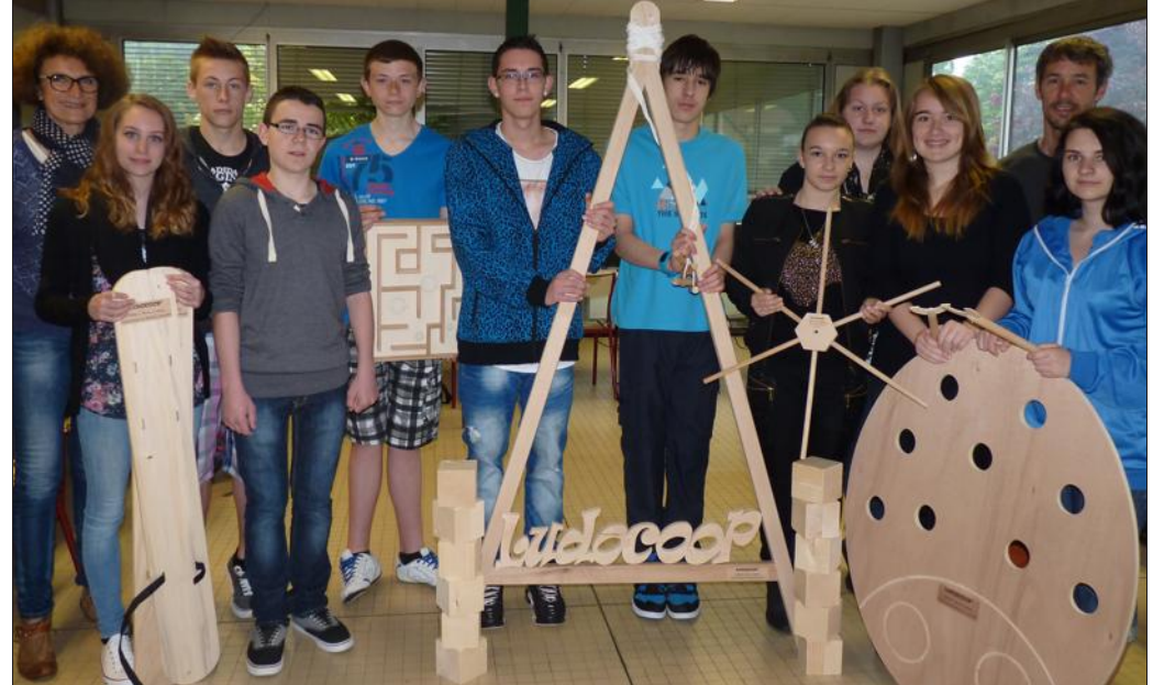
■ Ils représenteront la Lorraine au concours national des mini-entreprises.

Ils iront donc en national, à Paris les 4 et 5 juin. Et, pourquoi au concours européen à Tallin, en Estonie, en juillet prochain ?