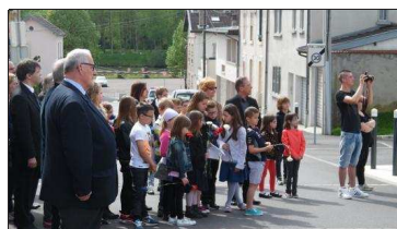
■ Les enfants des conseils municipaux ont déposé des roses.