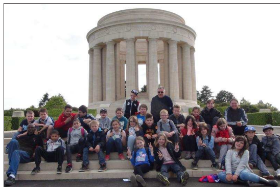
■ Les élèves devant le Mémorial Américain de la butte de Montsec.

Les élèves de CM1/CM2 de l'école Louis-Guingot sont partis du 5 au 7 mai découvrir les Côtes de Meuse. Après un départ en car, les élèves de la classe de Jean-Michel Bech, ont commencé par une visite des carrières d'Euville. Le site rassemble en un même lieu, une carrière en exploitation, des anciennes carrières, les maisons de l'ancien village des carriers et les bâtiments des anciennes exploitations renfermant des outils et des machines de toutes les époques de l'exploitation. Les écoliers ont pu pratiquer la taille de pierre en réalisant le nom de leur école : « Guingot ». Le montage des maquettes de monuments de l'Art Roman était également au programme. La deuxième journée était réservée à une balade dans la