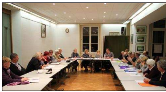
■ Réunion des bénévoles pour fixer les derniers détails de la fête médiévale