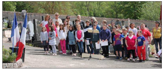
■ A la cérémonie, les enfants de l'école du Rond Chêne ont chanté d'une seule voix « La Marseillaise ».

de la mémoire devant les corps constitués, puis Martine Huot-Marchand, députée suppléante, a rappelé la page tragique de l'histoire et conclu cette commémoration avec un extrait du poème « Le veilleur du Pont-aux-Changes » de Robert Desnos, poète et résistant mort en camp de concentration le 8 juin 1945. Les élus et les représentants des anciens combattants se sont prêtés au rituel du dépôt de gerbe au monument aux morts, avant une réception dans la salle du conseil de la mairie.