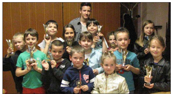
■ Les plus jeunes ont été récompensés de leurs efforts.