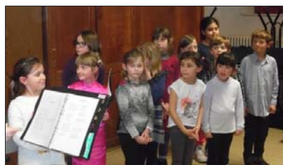
■ Les classes de solfège chantent avec conviction.

Qu'ils soient enfants ou adultes, ils partagent la même passion : la musique. Et la salle du centre socioculturel était presque trop petite mercredi 2 mars, pour l'audition des élèves de l'École de musique de Pompey, tellement parents et amis étaient venus nombreux pour l'occasion. En effet, les plus petits de la classe d'éveil musical ont ouvert les festivités avec 2 chants : « Les chinois » et « Au bord de la mer » avec un théâtralisation digne des plus grands, dirigés par Claude-Anne, professeur. Les classes de solfège, F1 et F2, ont « écrit sur les murs », « Le jour au mauvais endroit » de Calogero. Leurs aînés de F3 et F4 ont, quant à