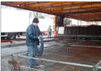
■ Les forains s'installent pour 10 jours de fête.

A partir d'aujourd'hui samedi 5 mars jusqu'au dimanche 13 mars, la place du marché, avenue Gambetta, accueille la traditionnelle fête foraine de printemps. Les forains ouvriront leurs stands à partir de 14 h, les week-end et le mercredi ; et à partir de 16 h, les autres jours de la semaine : « Même avec la pluie, nous serons là et espérons