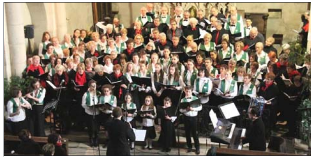
■ Les deux chorales réunies pour le final.