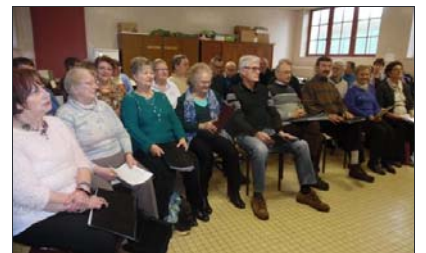
■ Les choristes répètent la Messe aux Chapelles.

Gounod pour le final d'un concert prévu le dimanche 18 mars, à 15 h, à l'église Saint-Epvre. Par ailleurs, la Villanelle participera à un concert mardi 8 mars, à partir de 14 h, avec d'autres formations à la salle des fêtes de Champigneulle.