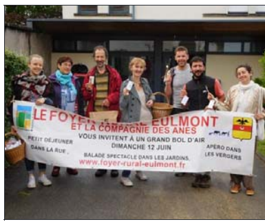
■ Une démarche originale pour inviter les habitants à sortir de chez eux.